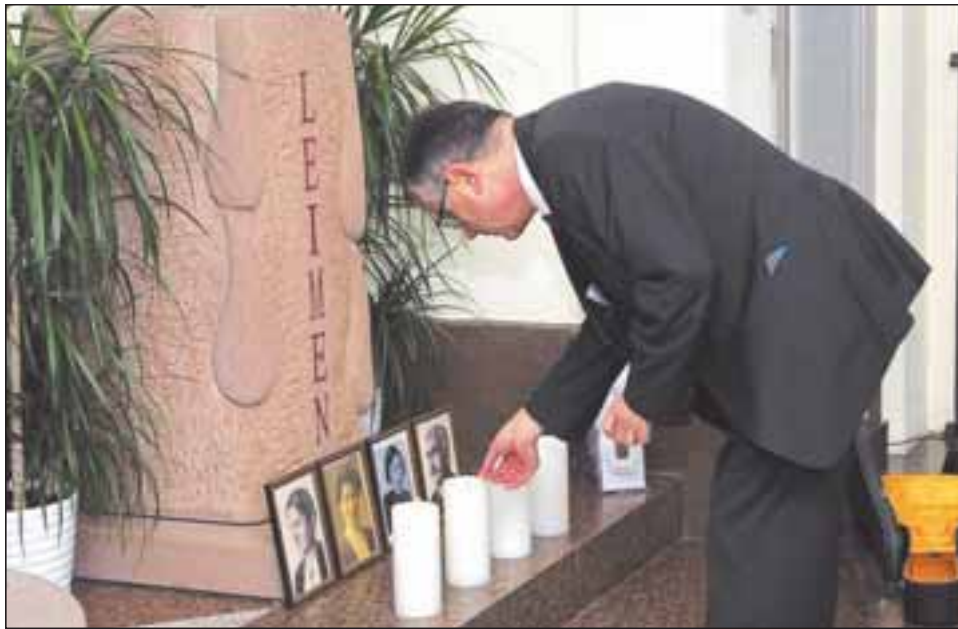
Oberbürgermeister Wolfgang Ernst zündete am Gedenkstein im Leimener Rathaus Kerzen vor den Bildern der deportierten und ermordeten Leimener Juden an.

Gedenkstunde am Gurs-Jahrestag – OB Ernst sieht Parallelen zu heute