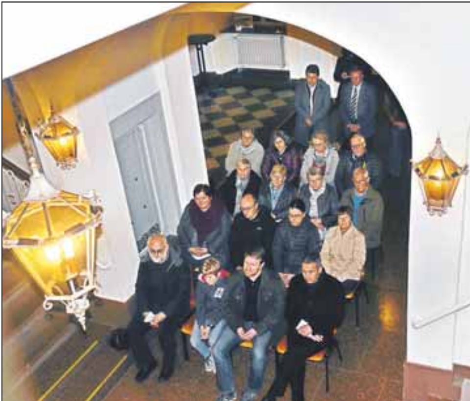
Der OB hätte sich zur Holocaust-Gedenkfeier mehr Gäste gewünscht.