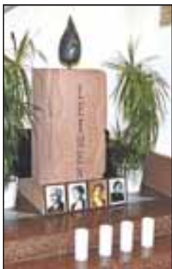
Der Gedenkstein im historischen Rathaus.

Im Foyer des Gebäudes steht seit einigen Jahren ein Gedenkstein für die Nazi-Opfer von Gurs und Auschwitz, den drei Schülerinnen der Geschwister-Scholl-Schule im Stadtteil St. Ilgen gestalteten. „Das